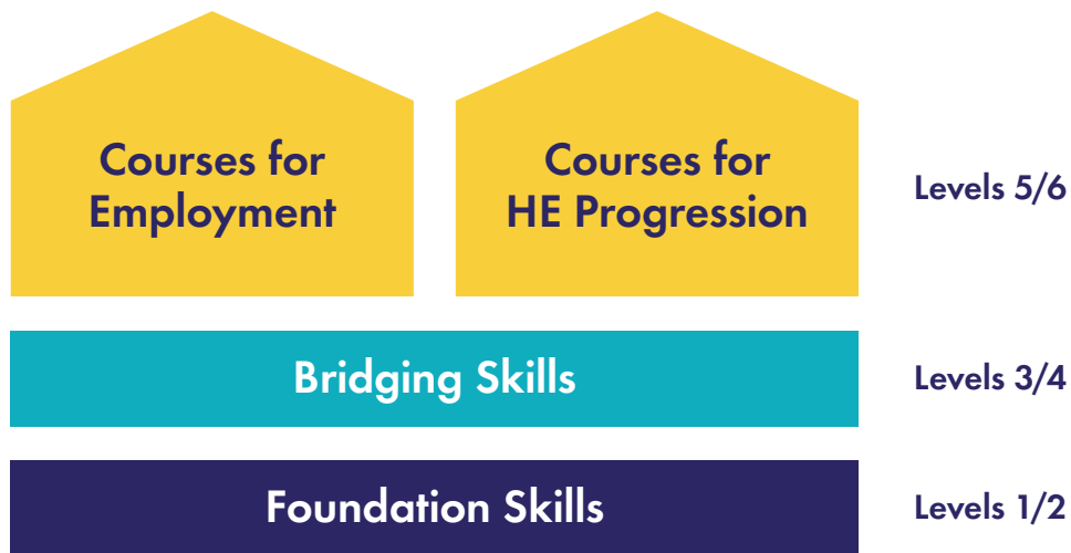
FÍOR 2.3: CREAT CHUN SOLÁTHAR FET A ATHSTRUCHTÚRÚ

Beidh tionchar ag an gCreat chun soláthar FET a athstruchtúró ar an gcaoi a dtéann foghlaimeoirí ar aghaidh tríd an gcóras FET agus ar an nasc idir FET agus ardoideachas trí chur chuige nua i leith oideachais treasaigh.